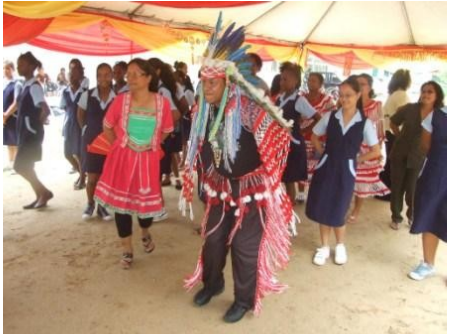
De Inheemse dansgroep Wayono participeerde volop tijdens de viering van het Chinese Nieuwjaar. Dit deden zij samen met de leerlingen van de Louise school.