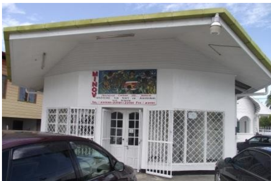
Afdeling Cultuur Nickerie