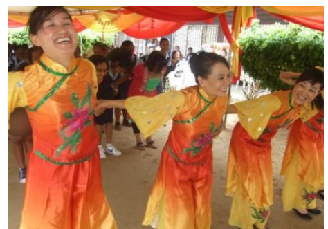
Chinese danseressen in actie.

de normale werkuren. Het blijkt dat de meeste van hun twee tot drie winkelzaken beheren en zich daarom het liefst in de avonduren beschikbaar stellen. Desondanks is ACUZA menens om deze groep ook zo ver te krijgen om in de toekomst samen met het Directoraat Cultuur verder te werken. De Chinese Culture and Art center heeft meteen het idee geopperd om een project in te dienen voor het aantrekken van een professionele dansleraar voor de Chinese dans technieken. De danseressen tijdens de workshop, zijn volgens Setrosentono geen professionals. Geconcludeerd mag worden dat ook hier de behoefte dringend aanwezig is om de kennis van Chinese cultuuruitingen te behouden. Terugblikkend op de viering van het Chinees Nieuwjaar mikt Setrosentono op een veelbelovende samenwerking met de Chinezen voor de toekomst.