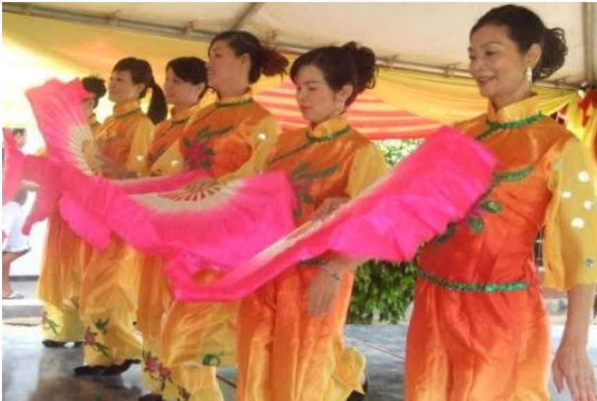
Danseressen van de Chinese Culture and Art Center tijdens de show en dansworkshop op het terrein van het Directoraat Cultuur, op vrijdag 20 januari 2012.