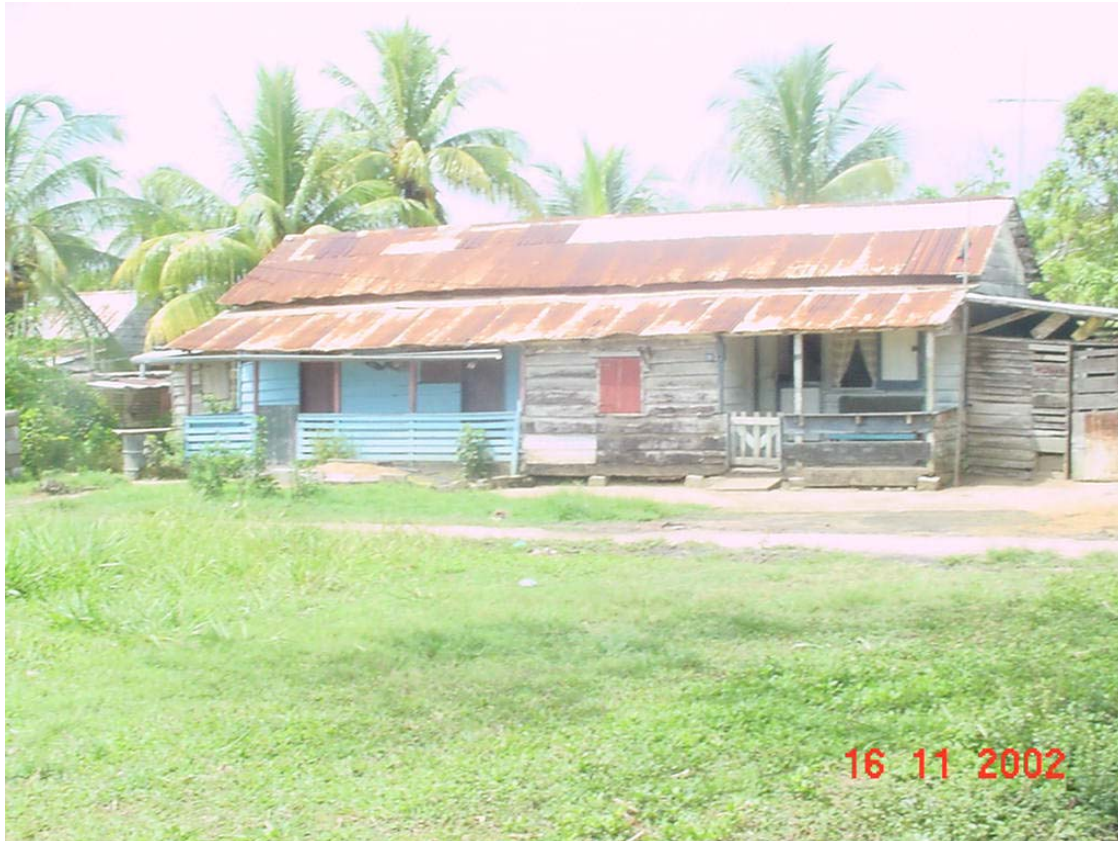
Foto: Contract arbeidersbarakken met 2 wooncompartimenten, op plantage Zoelen

Het gezin werd in dienst genomen door de Landbouw Maatschappij Commewijne. Ze werden ingedeeld op de plantage Zoelen. Vermoedelijk werd het gezin in een soortgelijk barrak gehuisvest zoals in onderstaande foto is te zien. Onder de Javanen wordt de plantage Zoelen ook wel "Solo" genoemd. Ongeveer 8 jaar na aankomst in Suriname overleed de heer Martodongso op 24 mei 1902 aan de gevolgen van beri beri. Toen de heer Martodongso overleed was Tje Mail 16 jaar oud.