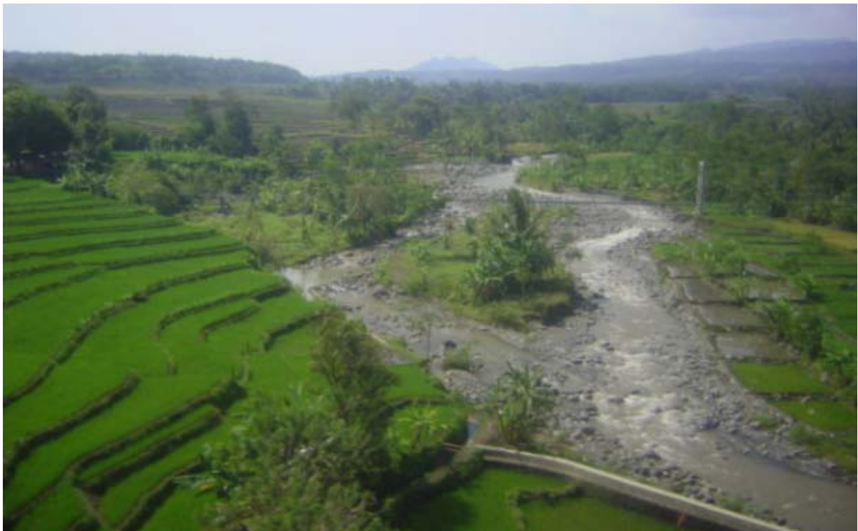
Rijstveld terrassen op heuvelhellingen vanuit de trein