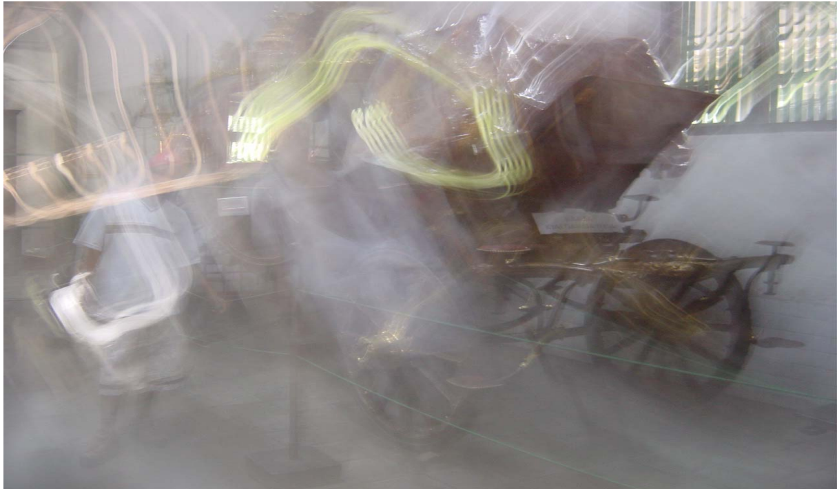
Clinton in wolk gehuld

gebruik is overgenomen, want de oude heer woonde in Suriname op plantage Meerzorg ook tussen de Javanen.