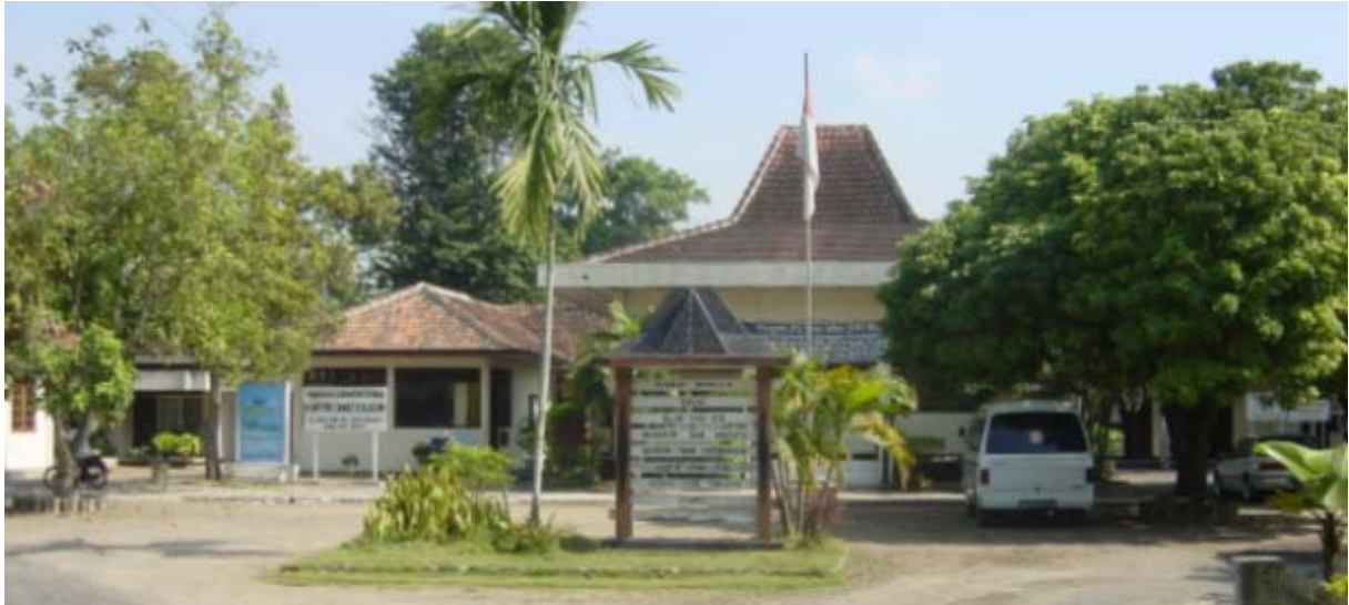
Kantor Camat Kalasan