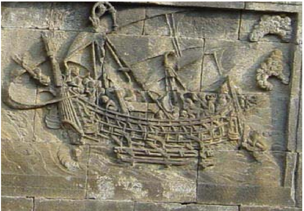
Een detail afbeelding in Borobudur

Van hotel Mutiara kan lopend ook een aantal bezienswaardigheden worden bezocht, waarvan een aantal: De kraton en Kreta museum en Taman Sari. Voor de ingang van Taman Sari, zo achter de vogeltjes markt verzorgt een kunstenaar batik lessen aan toeristen. Met zijn bejaarde vader heb ik even gezeten en gesproken. Hij sprak nog een beetje Nederlands. Dit hanen