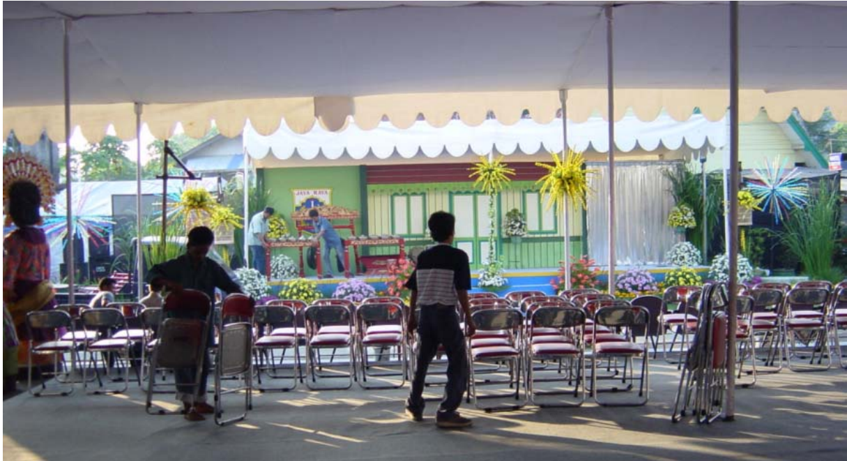
Vorbereiding voor het 450 jarige bestaan van de stad Jakarta voor Karya Hotel