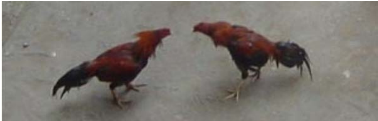
Hanen gevecht bij Taman Sari

gevecht lijkt illegaal te zijn gehouden bij Taman Sari. Ik heb nog naar de eigenaar van verliezende haan gevraagd maar die was niet gediend van een gesprek.