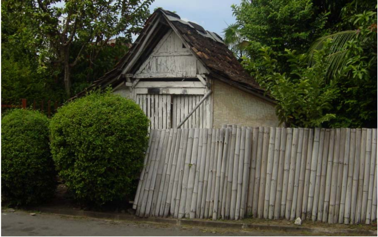
Een huisje met gevlochten palissades of bamboe (kebang) en een omheining van bamboe (pring) in Yogyakarta niet ver van de Kraton