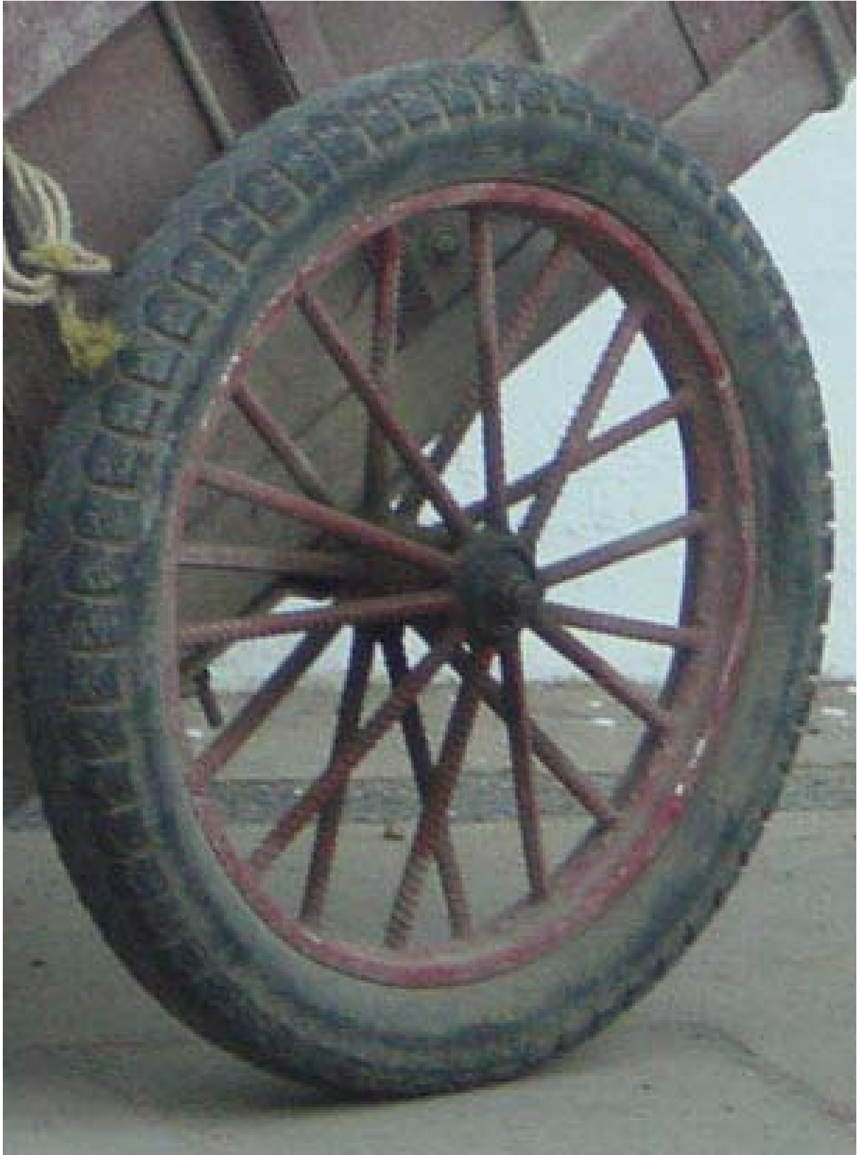
Zoektocht maakt de cirkel rond

Auteur: P.P. Mangoenkarso Rijswijk, 31 augustus 2005