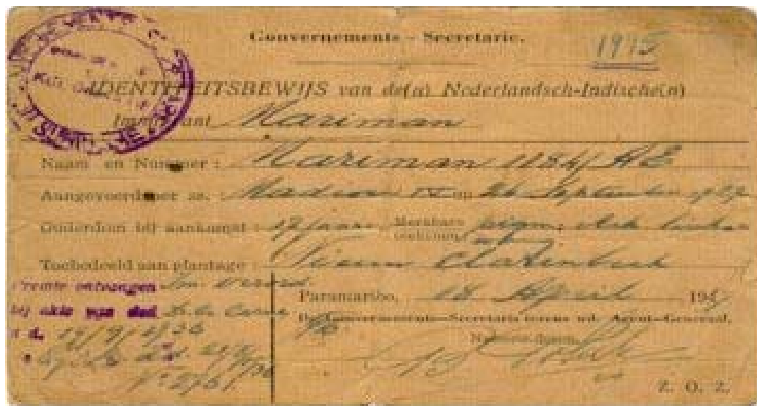
Identiteit bewijs "Lajang préman"