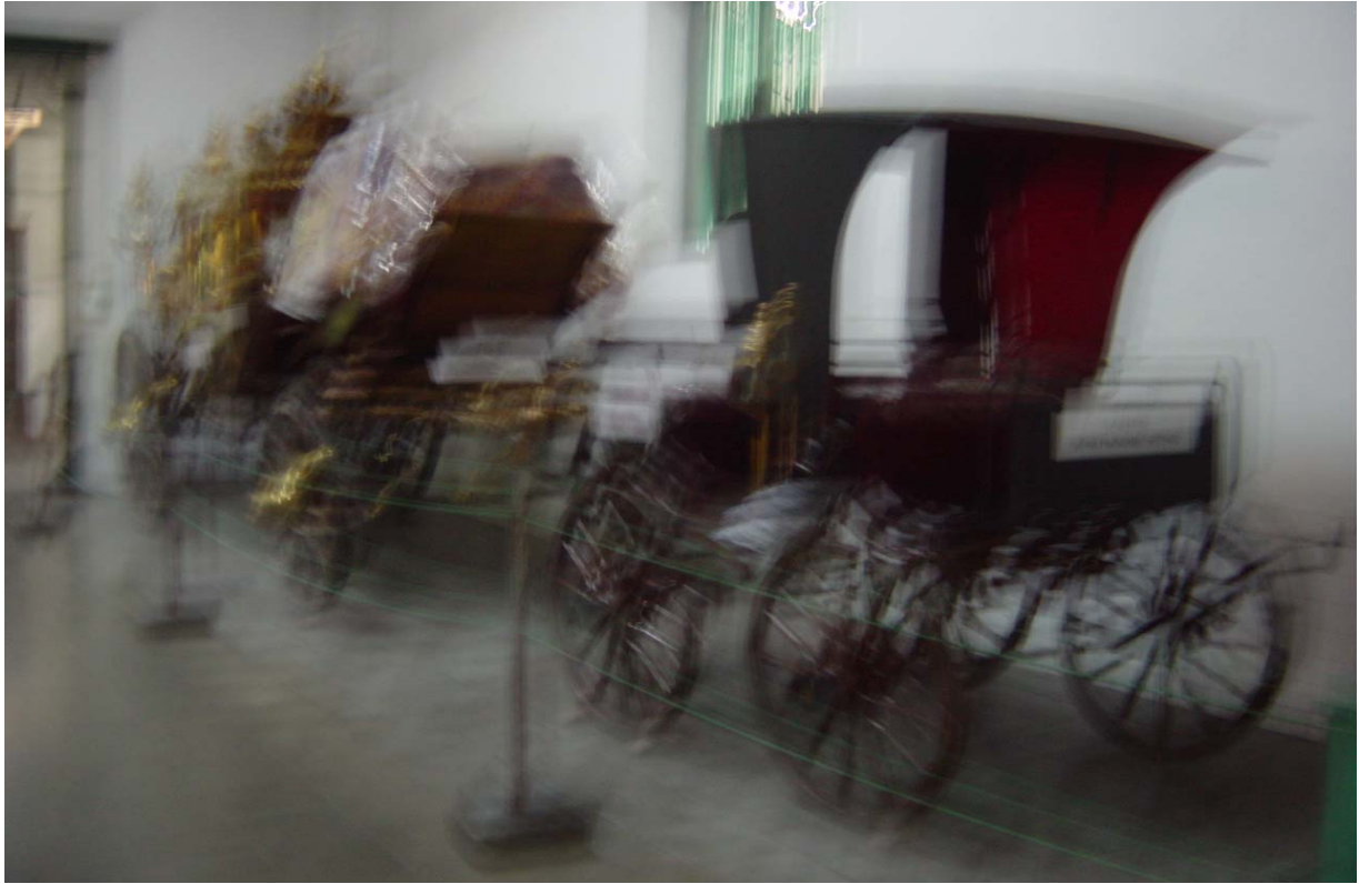
“Kerata djalan” of “De vertrekkende kreta”

In het hotel kwam ik ook in discussie met een welgestelde gast uit Jakarta. Hij is van mening dat het rijke westen de rijkdom met de arme landen moet delen. Na 11 september is dit fenomeen een veel gehoord standpunt. Voor deze heer heb ik een toepasselijk antwoord klaar. Ik heb deze heer gezegd dat ik als een adviseur van westelijk land zou zijn zou ik het advies geven dat ze dat niet moeten doen. Ik merk dat de rijken in Indonesia ook niet met de armen delen. Ze behouden ook hun rijkdom door rijken met rijken te huwen, niveau geschooldheid met niveau geschooldheid. Dit fenomeen gaat systematisch hand overhand in Indonesia. Daarnaast zien de rijken de armen ook niet staan. Ik zeg wel dat het westen met een land als Suriname wel moet delen, want in Suriname is het zo dat de mensen of ze arm, rijk of goed geschoold zijn wel met elkaar omgaan. Dus begin eerst te leren delen als ingezetenen en dan het westen vragen om de rijkdom te delen.