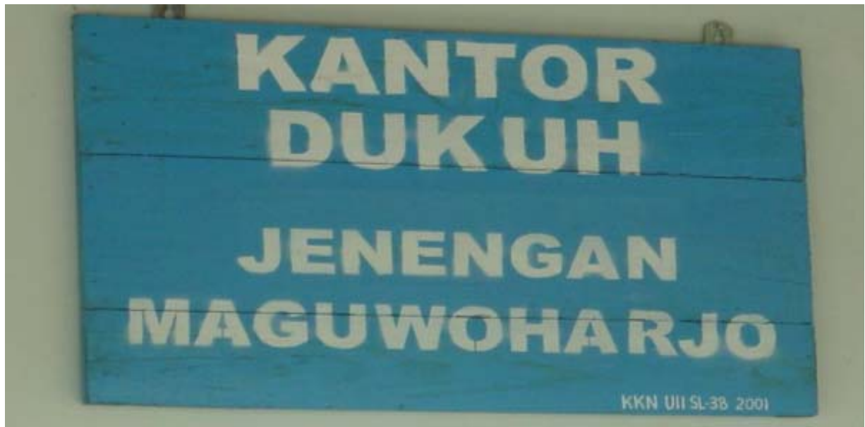
Foto: aan de muur van het huis van de Balai desa