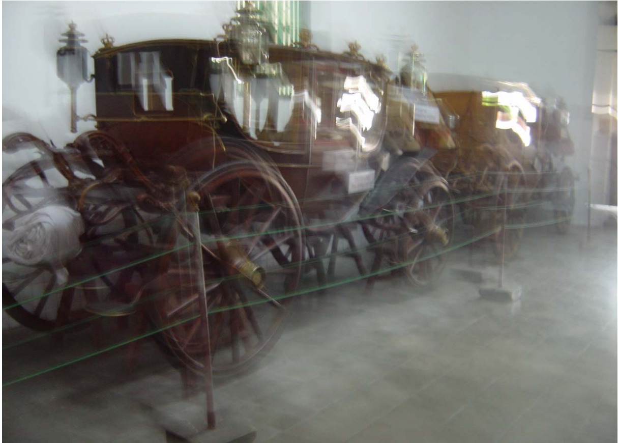
"Kerata djalan" of "De vertrekkende kreta"