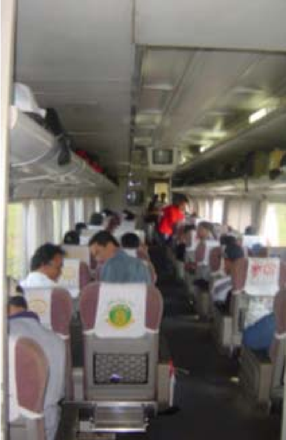
Esketief trein coupe

De terug reis van Yogyakarta naar Jakarta namen we een exekutief trein. De reis duurde ruim acht uren voordat we in station Gambir aankwamen. Ook deze rit geef je een inzicht van het mooie landschap. Maar in deze trein kan je weinig met je burens communiceren of contacten leggen. Op Gambir station namen we een taxi richting Jl. Jaksa en ook een wat goedkoper hotel, namelijk Le Margot voor 10€ per dag ++. De kamer heeft ook een douche, toilet en aircon en een twee persoonsbed. Het is er netjes. Als sarapan kan je kiezen uit bami goreng of nasi goreng. We verbleven drie dagen in Le Margot hotel tot aan ons vertrek.